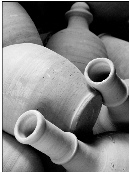
Sahar Seyedi (Pitchers)